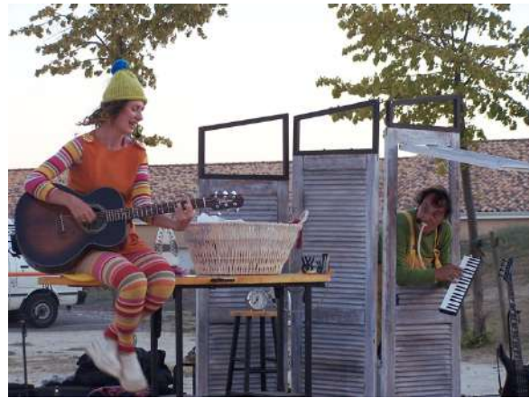
« Agathe cherche l'amour »