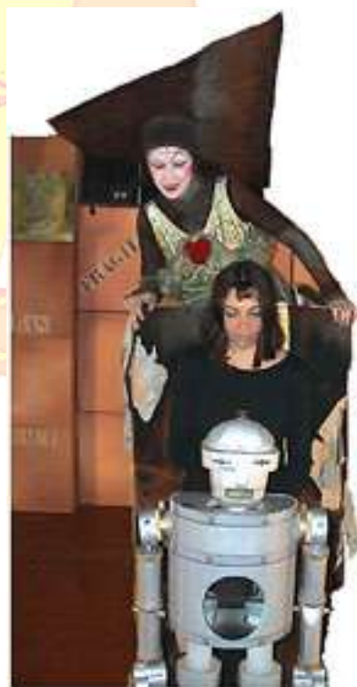
« Cadeau Cabosse »