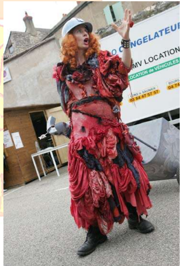
« Diva Commando »