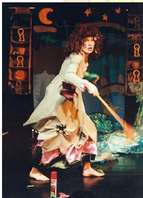
« Ouille, ouille, ouille ! Sac de nouilles... »

Un spectacle « Arts de la rue », « Diva Commando », crieuse publique lyrique, a été créé en 2007, au cours d'une résidence à l'Atelline, pôle arts de la rue en Languedoc Roussillon. Ce spectacle est toujours en cours d'exploitation.