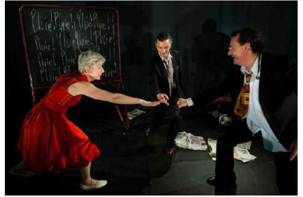
« Nom de code : PoPé »